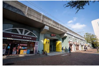
M' av みょうでん

東京メトログループでは、鉄道高架下用地の有効活用を図るため、M' av(マーヴ)みょうでん、メトロセンター等の高架下商業施設を展開しています。