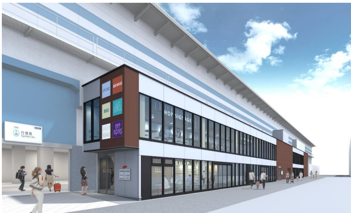
M' av 行徳 駅北口側施設完成イメージ

東京メトログループでは、東西線各駅をはじめ、お客様のニーズや周辺店舗・まちのイメージなどに合わせた高架下商業施設のリニューアルや店舗展開を行い、駅まち一体の賑わいのさらなる創出に取り組んでまいります。詳細は別紙のとおりです。